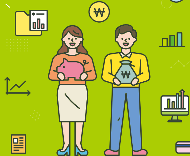
Stock Registration Service